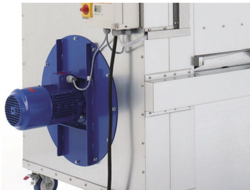
Afb. boven: Vacumobil VT 160 met energiebesparende motor van 2,2 kW (IE3)

De stromingstechnisch geoptimaliseerde binnenzijde van de behuizing en de standaard energiebesparende motoren (IE3) zorgen voor een toename van het afzuigvermogen bij een lager stroomverbruik. Tegelijk bieden de twee vulcontainers een groter nuttig volume. Een Vacumobil garandeert op die manier een uiterst milieuvriendelijke en energiebesparende werking. Vanzelfsprekend zijn beide modellen gekeurd volgens GS-HO 07 van de beroepsvereniging en werken ze uitsluitend met BG-gecertificeerd filtermateriaal.