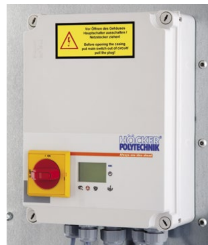
Afb. rechts: PLC-besturing met tekstdisplay en robuust folietoetsenbord